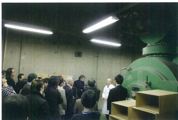
廃棄処理場の現状説明