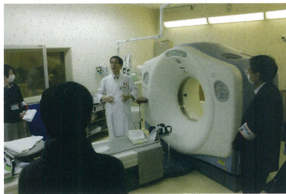
CT(コンピューター断層撮影)の説明